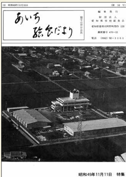
第14号 (昭和49年11月発行) 愛知県学校給食総合センターの完成

ランチルームが東浦町立北部中学校で設置されました。その後、ランチルームが普及していきました。