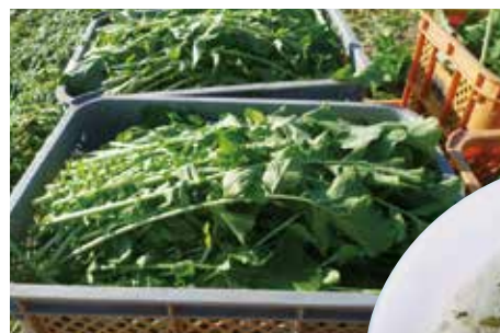
収穫された大根葉

当財団取扱いの学校給食用パン及びソフトスバゲティ式めんを使用している愛知県産小麦粉を平成28年11月買入れ分より品種を「農林61号」から「きぬあかり」へと切り替えることとなりました。愛知県では既に作付品種を「きぬあかり」へ切り替えを進めているところであり、それに伴っての切り替えとなります。新品種「きぬあかり」は「農林61号」より穂が長く、茎が太く倒れにくいため天候による影響を受けにくく、面積当たりの収量が多く見込まれる特長があります。成分値は「農林61号」とほぼ同等で灰分が低く、わずかながら黄色がかったものとなります。