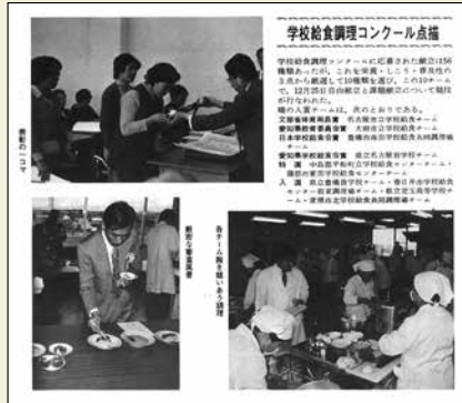
第16号 (昭和50年4月発行) 第1回学校給食調理コンクールの開催