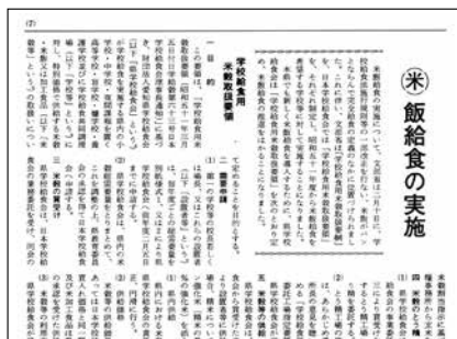
第21号 (昭和51年6月発行) 米飯給食の開始

当財団が愛知県学校給食総合センターとして豊明市に移転し、竣工式を迎えた11月11日に特集号として発行されました。特集ということもあり12ページにわたり施設の写真や当財団に期待する手記が掲載されています。