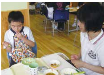
先生が野菜をすりつぶし、ごはんと混ぜることで、苦手な野菜を克服