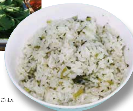
あいちの大根葉ごはん