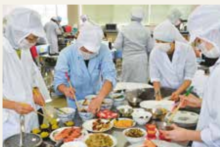
愛知の郷土料理講習会