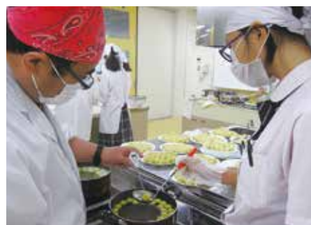
中心温度90℃、1分半以上を先生と一緒に確認