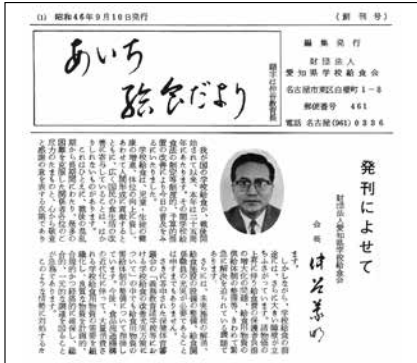
創刊号 (昭和46年9月発行) あいち給食だより第1号発刊

リニューアルを記念し、「あいち給食だより」から45年間の学校給食および当財団の歴史をたどってみました。