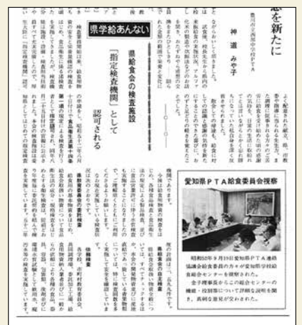
第27号 (昭和52年11月発行) 国が認可した検査機関

完全給食実施校における米飯給食実施率は、昭和51年5月は47.6%。1年ごとに55.5%、73.5%、79.1%と増加し、昭和55年7月には100%の実施率になりました。