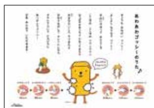
図1. 手洗いゴッシーの歌

高等部の職業コースでは、就労を意識した指導をしています。その一環としてくすのき祭で行ったカフェでは、衛生管理に気をつけて作業を行いました。これからも、社会で活躍できる衛生管理意識の高い生徒を育成していきたいです。