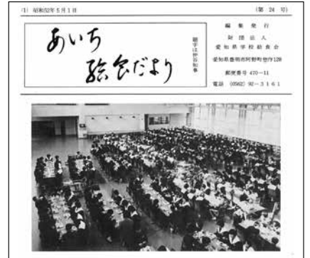
第24号 (昭和52年5月発行) ランチルームの設置

応募献立は56点で、栄養・嗜好・普及性の3点から厳選された10チームを選び、昭和49年12月25日に自由献立と課題献立についてコンクールが行われました。その後、毎年開催され平成25年度の第40回を最後に、現在の学校給食献立コンクールへと移り変わりました。