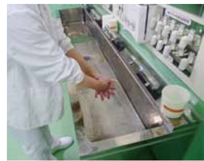
調理開始前は手洗いを2回

日本における黄色ブドウ球菌食中毒の主な原因食品は、おにぎりやそごい類、洋生菓子等の調理・加工品です。原材料が汚染されている可能性もありますが、多くの場合は、調理する人の手指のキズや手荒れに潜む黄色ブドウ球菌が食品を汚染し、食品中で菌が増殖し、同時にエンテロトキシンがつくられます。黄色ブドウ球菌は、環境中に広く分布するほか、キズや手荒れあるい