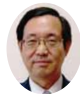
写真 常滑市立常滑東小学校