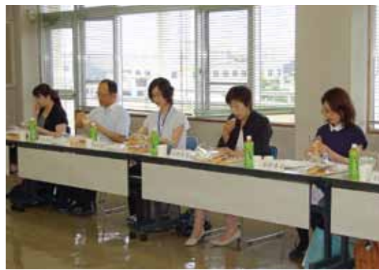
基本物資検討委員会 (ナンの試作品を試食)

究協議を重ね、平成二十六年四月から取扱を開始しました「五穀ごはん」と、本年九月から取扱を予定しています「ナン(県産麦入り)」をご紹介します。